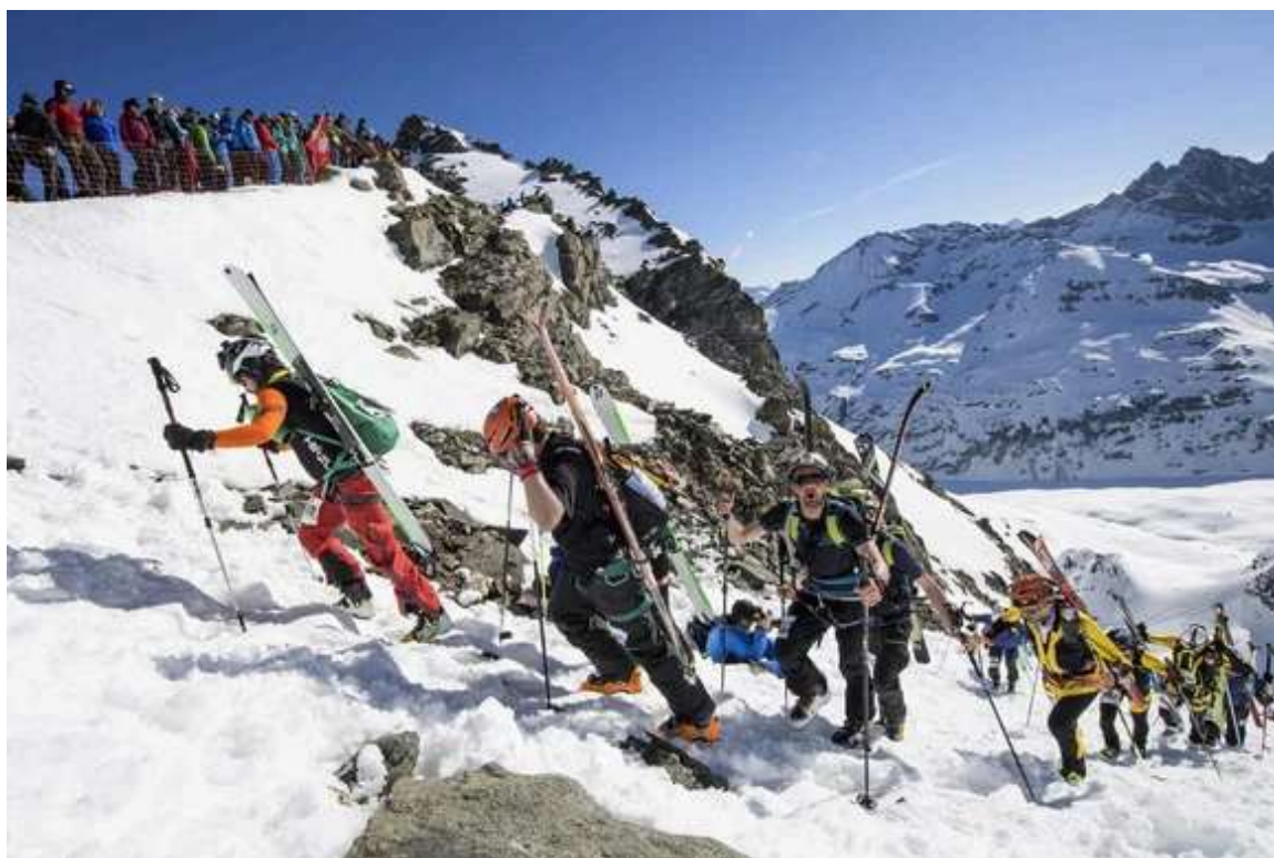
Le célèbre passage de la Rosablanche.

la majorité des participants n'a aucune connaissance de la montagne. Moi, je suis persuadé du contraire. Je suis convaincu que ce sont presque tous des amoureux.»